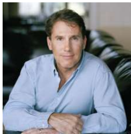
Nicholas Sparks , (54)